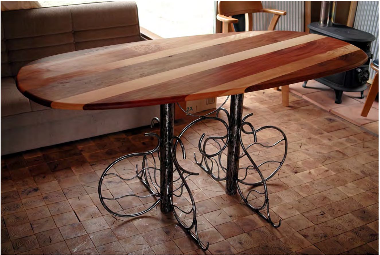
• oval table 希望小売価格 ¥250,000

伊藤環境デザイン研究所 〒299-4612 千葉県いすみ市岬町江場土2-5 Tel: 0470-87-6946 E-mail: mikio-ito@mikio-itodesign.com