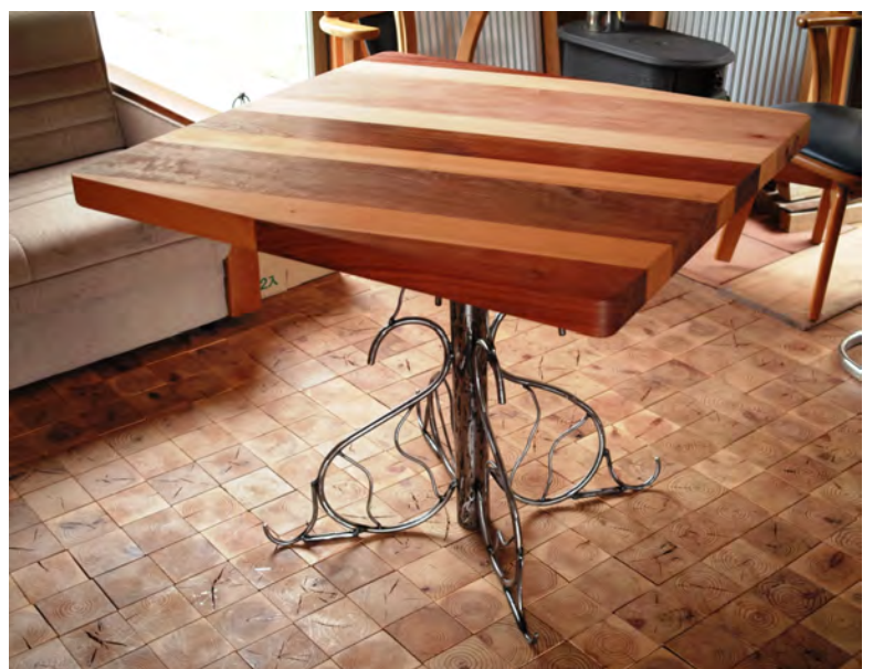
• square table 希望小売価格 ¥160,000

この家具は、寸法、脚の形状、材料の組み合わせなど、お客様の要望に応じてお作りします。